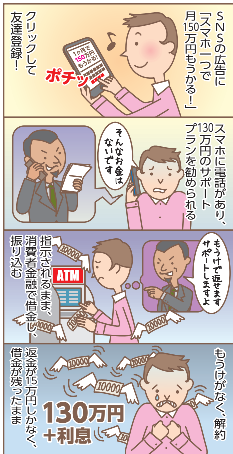
※2: ソーシャルネットワークサービスの略で、インターネットを介して人間関係を構築できるスマホ・パソコン用サービスの総称