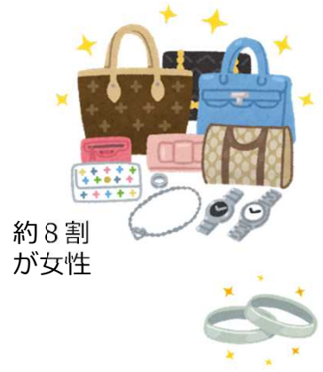
品目別ワースト5 (2021年度)