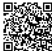
クーリング・オフ制度

◎ 電話勧誘で契約した場合は、特定商取引法に定める「電話勧誘販売」に該当します。電話で購入を承諾しても、契約書面を受け取った日から数えて8日以内であれば、書面またはメール等で クーリング・オフ することができます。