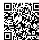
消費者庁チャリン

（注文や契約をしていないのに金銭を得ようとして送り付けられた商品は、消費者が自由に処分してよいことになっています。ただし、家族や知人等が注文している事例もありますので十分確認をとりましょう。）